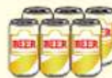
ビール 350ml 6本セット